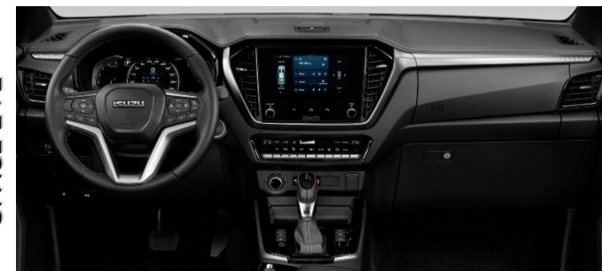
Foto non conformi agli standard contrattuali. I colori effettivi della carrozzeria dei veicoli potrebbero variare leggermente dai colori nelle fotografie stampate in questo catalogo.