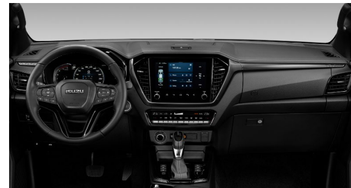
Foto non conformi agli standard contrattuali. I colori effettivi della carrozzeria dei veicoli potrebbero variare leggermente dai colori nelle fotografie stampate in questo catalogo.