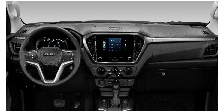
Foto non conformi agli standard contrattuali. I colori effettivi della carrozzeria dei veicoli potrebbero variare leggermente dai colori nelle fotografie stampate in questo catalogo.