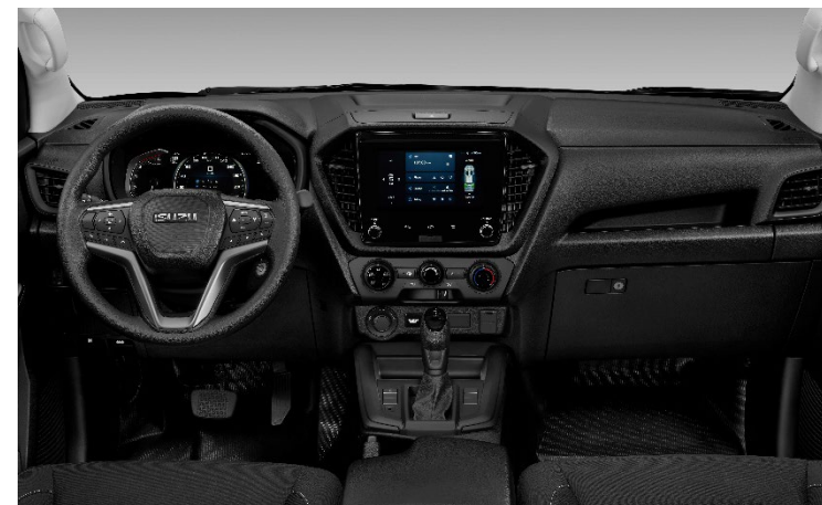
Foto non conformi agli standard contrattuali. I colori effettivi della carrozzeria dei veicoli potrebbero variare leggermente dai colori nelle fotografie stampate in questo catalogo.